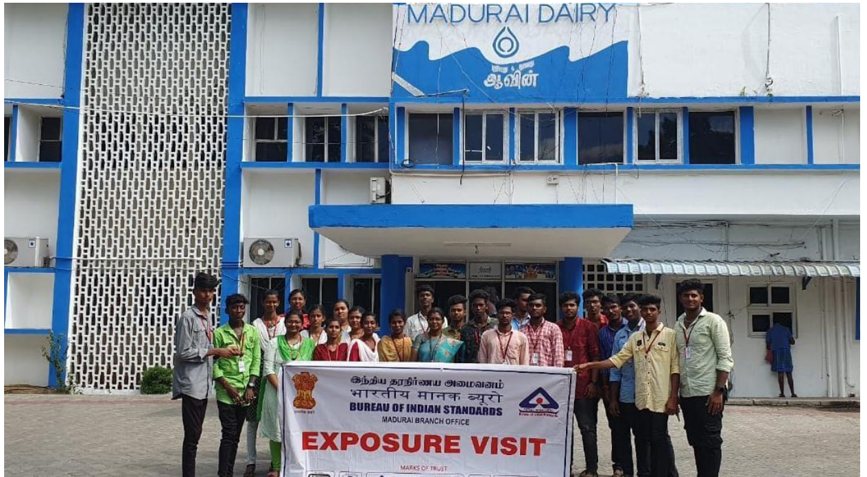
II year B.Sc. Food and Dairy Technology